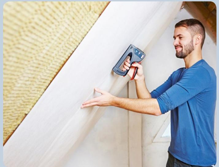
Folie beim Dachbodenausbau einfach befestigen.